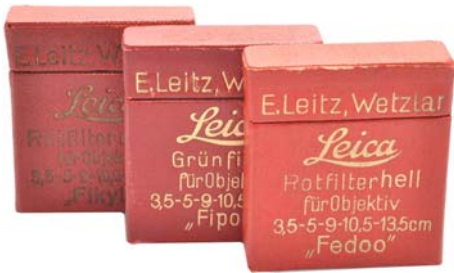
写真1 金文字が輝くライカのアクセサリ

「なんちゃって トイカメラワールド」と題してトイカメラに関しての話をさせていただきます。