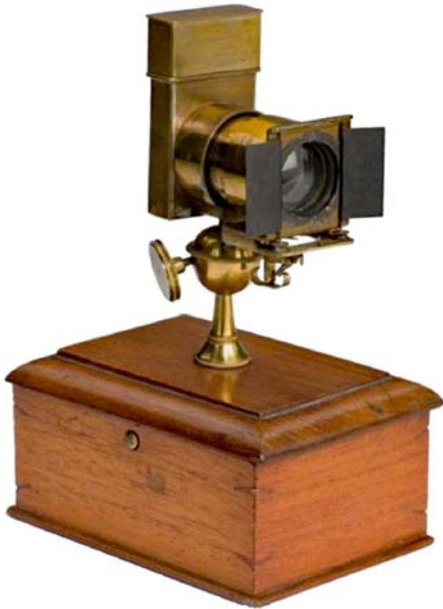
写真3 T.スカイフがデザインしたピストルグラフ

れた序文が書いてあります。ダグレオから始めて、大きいカメラから、小さいカメラに変わっていく中で、あるものに似せた、模造されたカメラなどが登場してきます。本の中では、シャーロックホームズに魅せられたデザイナーによる探偵カメラの出現が書かれてました。それは、箱型のハンドバックのような、またはジャケットのボタンのような、でした。20世紀に変わるところにはピストルに模造したカメラなども出てきます。こう言った模造カメラ、今でもかなりの高額品ではありますが、実は、なんちゃってカメラの起源ではないかと考えてます。