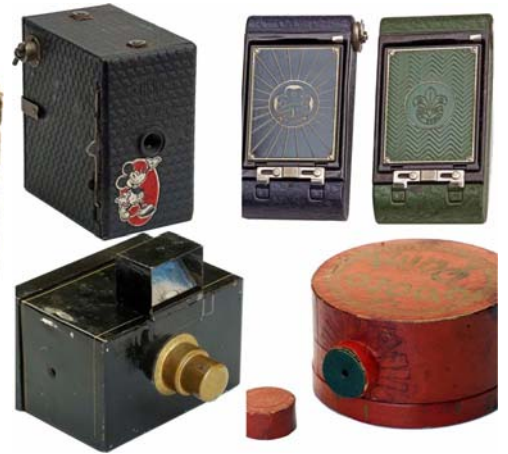
写真5 ブローニーボックスカメラと 同時期の子供向けトイカメラ

素材は、ボール紙やプラスチック製。ブリキ製や木製などもあります。ターゲットは、子供、学生やヤング世代。教育目的で作られたものもあります。とにかくシンプルに撮影を楽しむための理由から、単焦点、もちろん一枚玉、そして単速、1速。簡易で軽便なカメラ、軽くて、カラフルで、そして何より安い。コストを安く抑えたいので、販促品やノベルティ、賞品や景品等にもなりました。その数は確認ができないほど多数と思います。日本の円カメラもそれに当たると思います。そして、おそらく世界的に最初に大ヒットしたトイカメラがKodak Brownie original (写真4)ではないかと思っています。1900年に発売されました。元箱には、カナダの作家でイラストレータのパーマックス Palmer Coxが書いた妖精くんの物語「Brownies」のブローニー君がデザインされています。アメリカでも大人気のキャラクターだったので、子供をターゲットにするには最