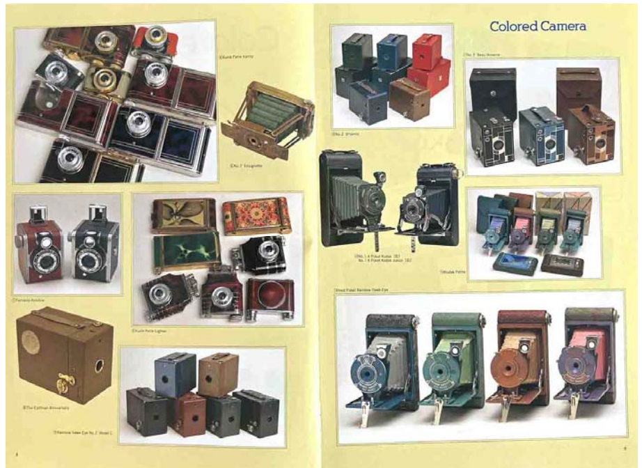
写真2 カメラレビューNo.48の特集

かなりの量を集めました。これがきっかけで、ウィーンのカメラ博物館の創設メンバーに呼ばれて、ライカのアクセサリを担当し、暫くはウィーンで過ごしておりました。アクセサリを集めていくうちに、もっと素敵でデザインの良い箱に出会います。それは、コダックのVPKの、色物シリーズです。結構集めました。そして、カメラレビューNo.48でも特集を組ん