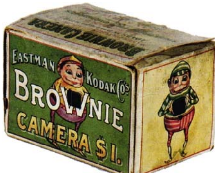
写真4 世界最初に大ヒットしたトイカメラ Kodak Brownie original

た。約2.5cm四方です。かなり小さいです。ほんとかどうかはわかりませんがこんなエピソードも残ってます。このカメラをコートに隠して、当時のヴィクトリア女王を撮影しようとしたところ、警官にとらえられたそうです。ピストルではなくカメラと分かってすぐに釈放されたというエピソードです。