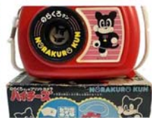
変な形のカメラ色々