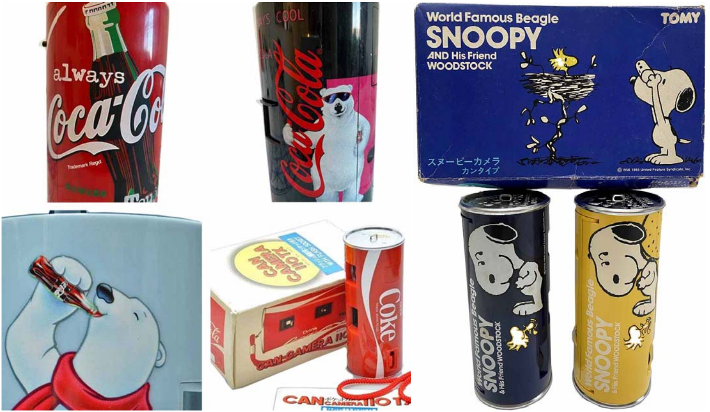
コカ・コーラブランド缶