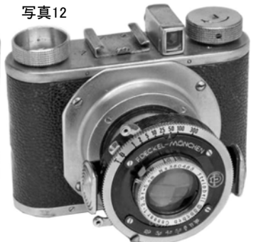
写真12 第四世代:トッププレート、ボトムプレートがニッケル鍍金になった。鏡胴の構造が改められ、フランジの切欠きは上下の他に左側が加わった。