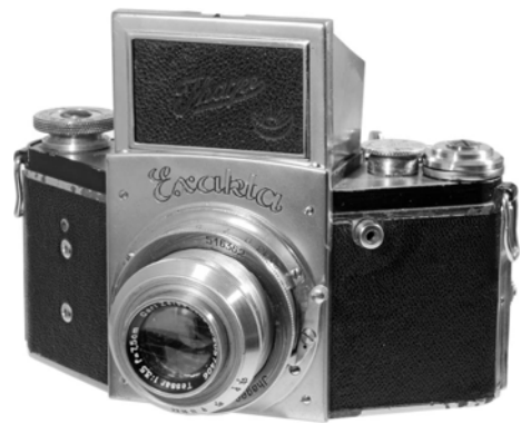
写真7 エクサクタ B (type 5.2)