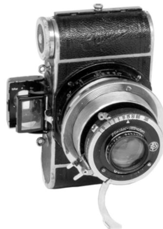
写真4 パルヴォラ ベスト判・名刺判兼用型。シャッター・スピードの指標の位置に注意。