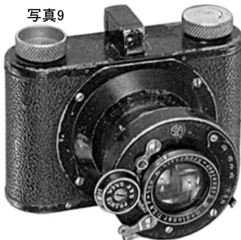
写真9 最初期型:ファインダーはトッププレート中央にある。シャッターは、ダイヤルセットのフロント。レンズはラジオナーF2.9/50mm。トッププレート、ボトムプレート、沈胴式の鏡胴は共に黒色塗装。(McKeown's Cameras 2001-2002より転載)