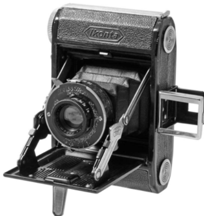
写真3 イコンタ(520/18): 通称ベビー・イコンタ。従来通りのセルフエレクティング(スプリング)カメラ。