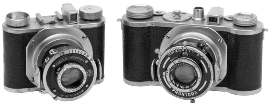
写真1 ゲヴィレツェとエディネックス

ドイツのカメラ業界では、1930年代の前半に大きな潮流の変化が見られた。1925年発売のライカを契機として、カメラの小型化、ボディの金属化が始まったのである。