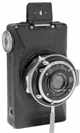
写真2 コリブリ: 沈胴式のレンズ・シャッター部分と全金属製の革張りボディが特徴。シャッター部分には取外し可能な前足が付く。

ツァイス・イコン展を担当して知ったことの一つは、プレート・カメラやロールフィルム・カメラの立ち姿が縦長で、撮影画面も縦長だったことである。当初の撮影ターゲットが人物、つまり肖像写真だったことに由来するものと考えられる。ところが、半截判の採用でこのバランスが崩れた。縦長ボディでは撮影画面が横長になってしまう。コリブリもベビー・イコンタも立ち姿は縦長で撮影画面は横長である。縦位置撮影ではボディが掴み難い。