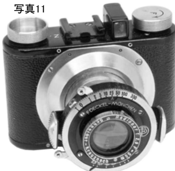
写真11 第三世代:レンズ・シャッター部に引き出し用のつまみが追加された。鏡胴部がニッケル鍍金にかわった。鏡胴部を引き出すと、定位置で自動ロックされる。