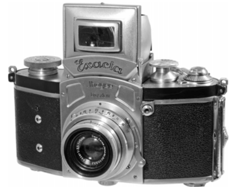
写真8 キネ・エクサクタ

る。しかし、パトローネ室を膨らませたために、フランジの一部をカットせざるを得なかった。こうして開発されたエディネックスは、1935年に発売された。ここに使われたアッセンブリは、ゲヴィレットの第四世代にも流用されている。従って、ゲヴィレットの第四世代は1935年以降の発売と見て間違いはない。