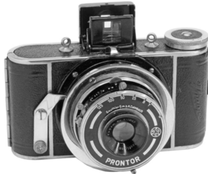
写真6 パルヴォラ ベスト半截判用。シャッター・スピードの指標の位置に注意。