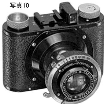
写真10 第二世代:アクセサリー・シューが追加され、ファインダーは向って右側に移動。シャッターはリムセットのコンパー。