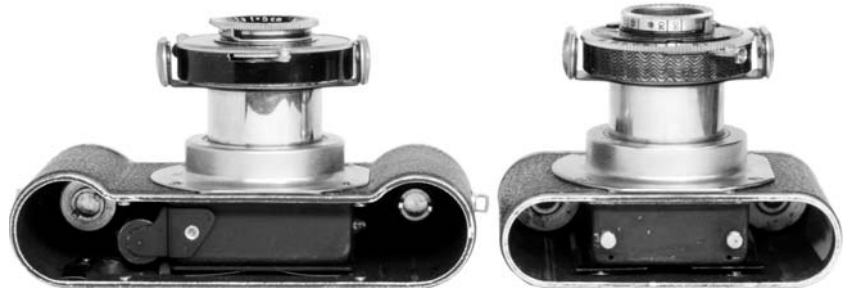
写真13 エディネックスのボトム・ビューとゲヴィレットのトップ・ビュー。エディネックスのボトムプレートとゲヴィレットのトッププレートをとり外し並べると共通点がよく解る。

ボディの厚さを変えなかったのは、レンズ・シャッター・アッセンブリを共用するためである。