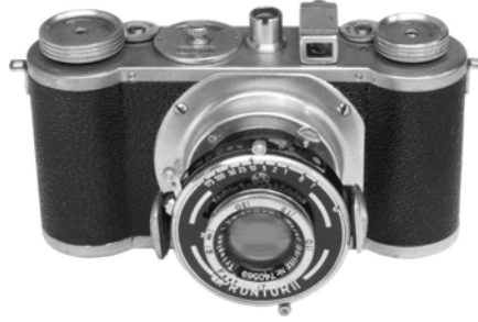
写真14 エディネックスのトッププレート。 中央にあるのがフォコスのソケット。

押し出し成型のボディシェルを持つライカを生産したライツは、同じヘッセン州ギーセン郡ヴェッツラーにある。ヴェッツラーはヴィースバーデンの北北東約50kmにあり、交流があったことは否定できない。押し出し成型ができる工場はどこにでもあるわけではないので、両社が同じ工場に製造を依頼していたことも考えられる。