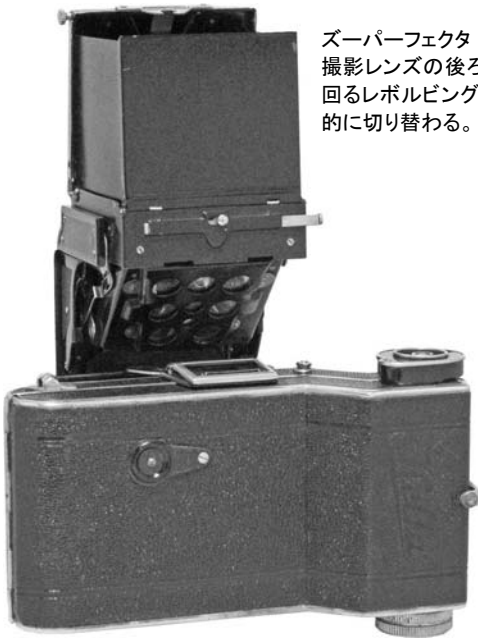
スーパーフェクタ 撮影レンズの後ろにターンテーブルがあり、蛇腹以後が左へ90度 回るレボルビングバック。同時にファインダー内ではマスクが自動 的に切り替わる。