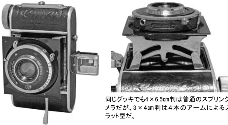
同じグッキでも4×6.5cm判は普通のスプリングカメラだが、3×4cm判は4本のアームによるストラット型だ。