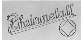
戦前型ではWeltaと入っていたところにRheinmetallの文字とロゴが刻まれている。ラインメタルは大手鉄鋼、重工業工場であった。