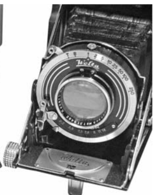
オートセミノルタ(左)とヴェルトウール6×6cm/4.5×6cm(右)。 ベースボード先端の距離スケールも同じ。