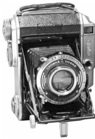
1935年のヴェルトウール 4.5×6cm(右)と1937年のオートセミノルタ(左) 1937年のオートセミノルタはヴェルトウール4.5×6cmにブラウベル・ロール オーバーの自動巻き止めを組み合わせたものであった。ただしトップカバーは ヴェルトウール6×6cm/4.5×6cmのクロームのデザイン。