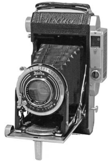
1938年 ヴェルトウール 6×9cm/4.5×6cm兼用 ゾリダの発展型で、ファインダーが一 眼式になり、仕上げがニッケルからクロームになった。 レンズ:クセナー 105mm F3.8 シャッター:コンパー・ラビッド T、B、1-400