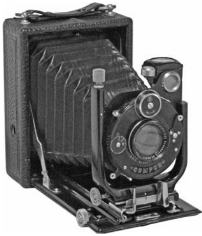
1924年 ワトソン 6.5×9cm 初期のハンドカメラの1例。木製ボディ、ラック &ピニオンの二段伸ばし。上下・左右のシフト。 レンズ:クセナー 105mm F4.5 シャッター:旧コンパー T、B、1-250