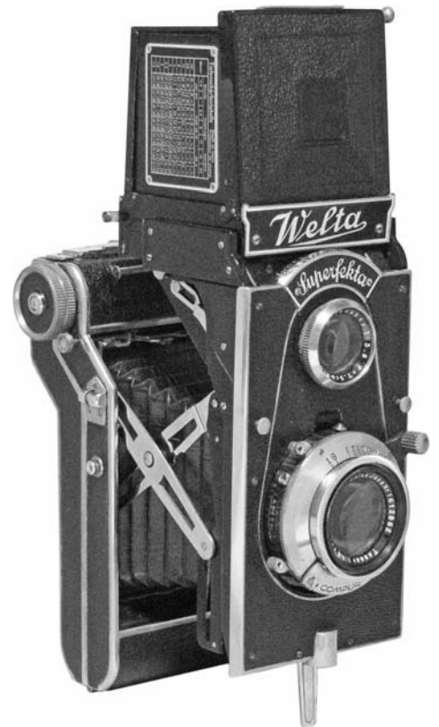
1935年 ズーパーフェクタ → 6×9cm判の大型二眼レフで、スプリングカメラでもある。ビューレンズはヴェルタスコープ75mm、F3.8と短いが、ちゃんと連動する。 レンズ:テッサー 105mm F3.8 シャッター:コンパー・ラピッド T、B、1-400