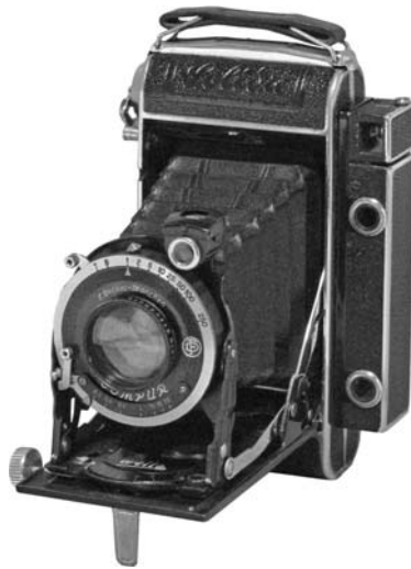
1933年 ゾリダ 6×9cm/4.5×6cm判兼用スプリングカメラに連 動距離計を加えたもの。焦点調節はラック&ピ ニオン。ローデンシュトゥック・クラロヴィットはこの ボディに同社のレンズを装着したもの。 レンズ:クセナー 105mm F3.8 シャッター:新コンパー T、B、1-250