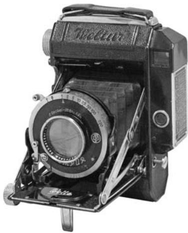
1935年 ヴェルトウール 4.5×6cm 距離計連動のセミ判スプリングカメラ。まだ黒ペ イントとニッケルメッキ。焦点調節はラック&ピ ニオンの繰り出し。 レンズ:クセナー 75mm F2.8 シャッター:新コンパー T、B、1-250