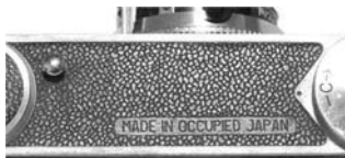
コニカ I 型の後期には底部の張り革(擬革)への型押しが変わった (Body No. 40569)。