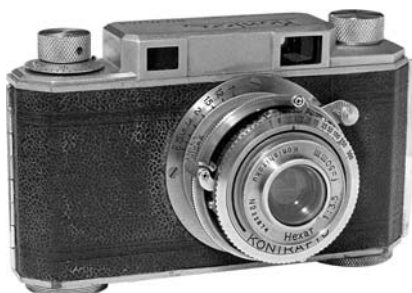
MIOJ表記が最も多く見られるコニカ I 型 (小西六写真工業1948年3月～1953年8月)

1949 年 12 月 5 日の SCAPIN 2061 「輸出品のマーキング(原文抜粋下記)」では、SCAPIN 1535 を廃止し、「Made in Occupied Japan」、「Made in Japan」もしくは「Japan」の 3 種の表示が認められ実質的には「Occupied Japan」としなくても良くなった。