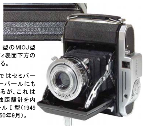
スーパー I 型の MIOJ 型押しはボディ表面下方の張り革にある。

→小西六ではセミパールやベビーパールにも MIOJ があるが、これは初めて単独距離計を内蔵したパール I 型(1949年4月～1950年9月)。