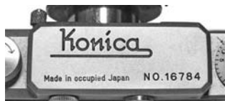
コニカ I 型の MIOJ 表記は初期には軍艦部への刻印である (Body No.16784)。