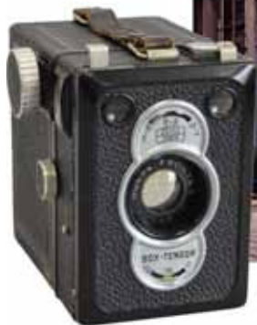
老舗 神藤 弘充